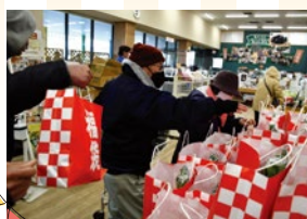
昨年の様子(こったま〜や)

お年玉企画で ポイント5倍 &各店おススメの福袋販売! 新年も新鮮で安全・安心な 地場産品をどうぞ(^^) /