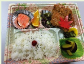
かもめ弁当×よれっしゃ・こいっちゃん