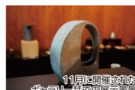
11月に開催されたギャラリー集での展示風景