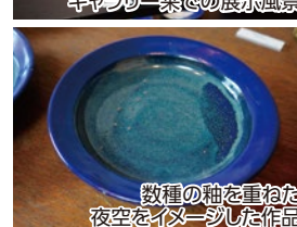
数種の釉を重ねた夜空をイメージした作品