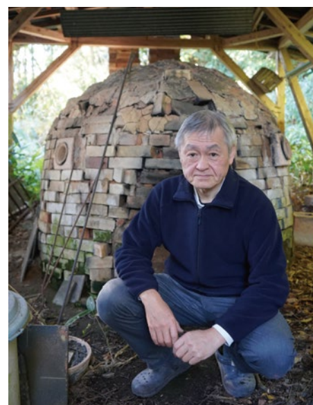
手作りの登窯(のほりがま)