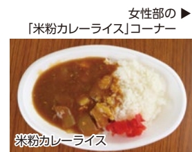
女性部の「米粉カレーライス」コーナー