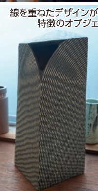
線を重ねたデザインが特徴のオブジェ