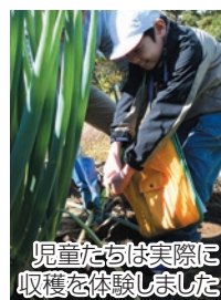
児童たちは実際に収穫を体験しました