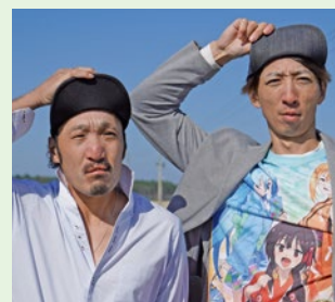
ブロッコリー生産者