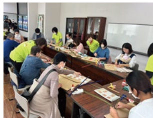
部員に教わりながら、みなさん真剣です