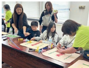
紙袋エコバッグを作る親子

10月25日(土)かみはやし支店で行われた収穫感謝祭で、女性部岩船地区と女性部かみはやし地区は共同で「紙袋エコバッグ作り」、「シャカシャカおにぎり」の体験コーナーを開きました。紙袋エコバッグは先着35人分が早々に予約で埋まり、シャカシャカおにぎりも先着250人分が、あっという間になくなりました。どちらのコーナーも小さい子どもから大人まで多くの方に体験していただきました。