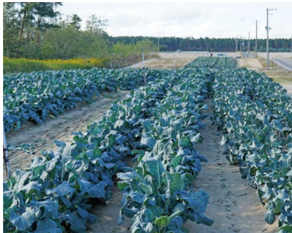
紫雲寺地区の砂丘地に広がるブロッコリー圃場