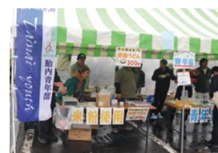
◀ 青年部の「米粉うどん」コーナー