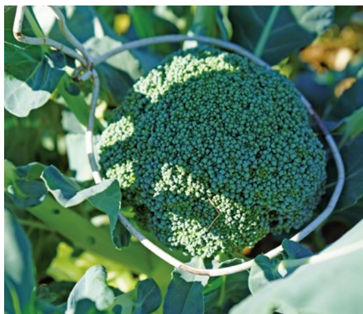
収穫間近のブロッコリー。ピンポン玉サイズから7日から10日ほどで収穫できるようになる