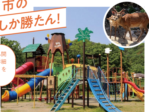
たるがはしゆうえん 樽ヶ橋遊園

"小動物園とアトラクションが一体となった「見て、触れて、遊べる」遊園地”土日祝日はエサやりなどのふれあい体験も行っています。四季折々の景色を楽しみながら、ゆったりとした時間をお過ごしください♪