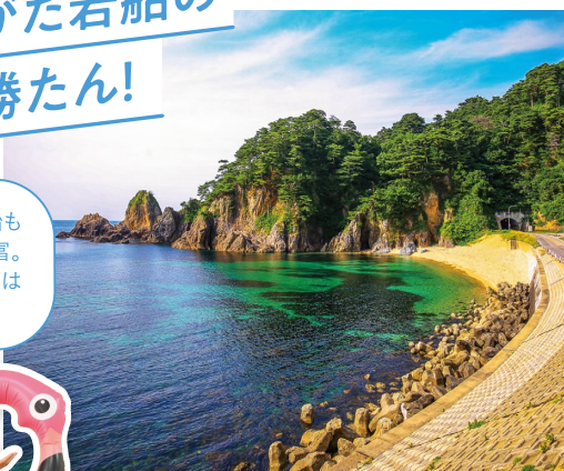
ささがわながれ 笹川流れ

村上市山北地区の延長11キロにわたる海岸線が笹川流れです。国の名勝にも指定されている景観は、幕末の儒学者・頼三樹三郎も讃えています。ドライブもよし、常に澄んだ海で海水浴もよし!